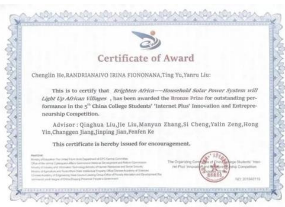
全国第五届“互联网+”国际赛道三等奖