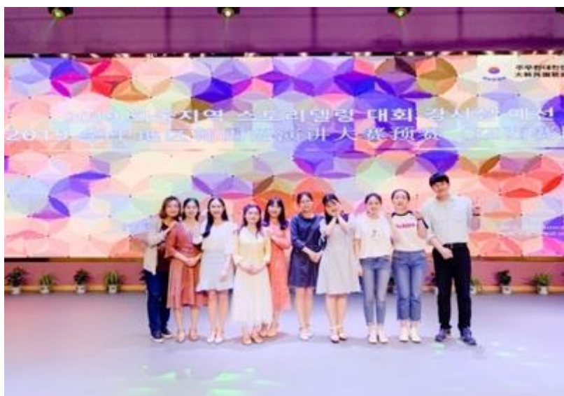
2019 华中地区韩国语演讲大赛