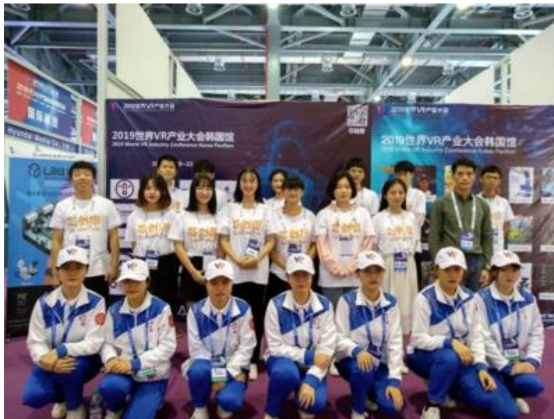
2019 世界 VR 产业大会的韩语翻译实践活动