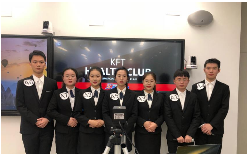
学生获 2020 年 “高教社” 杯全国商务英语实践大赛全国总决赛二等奖