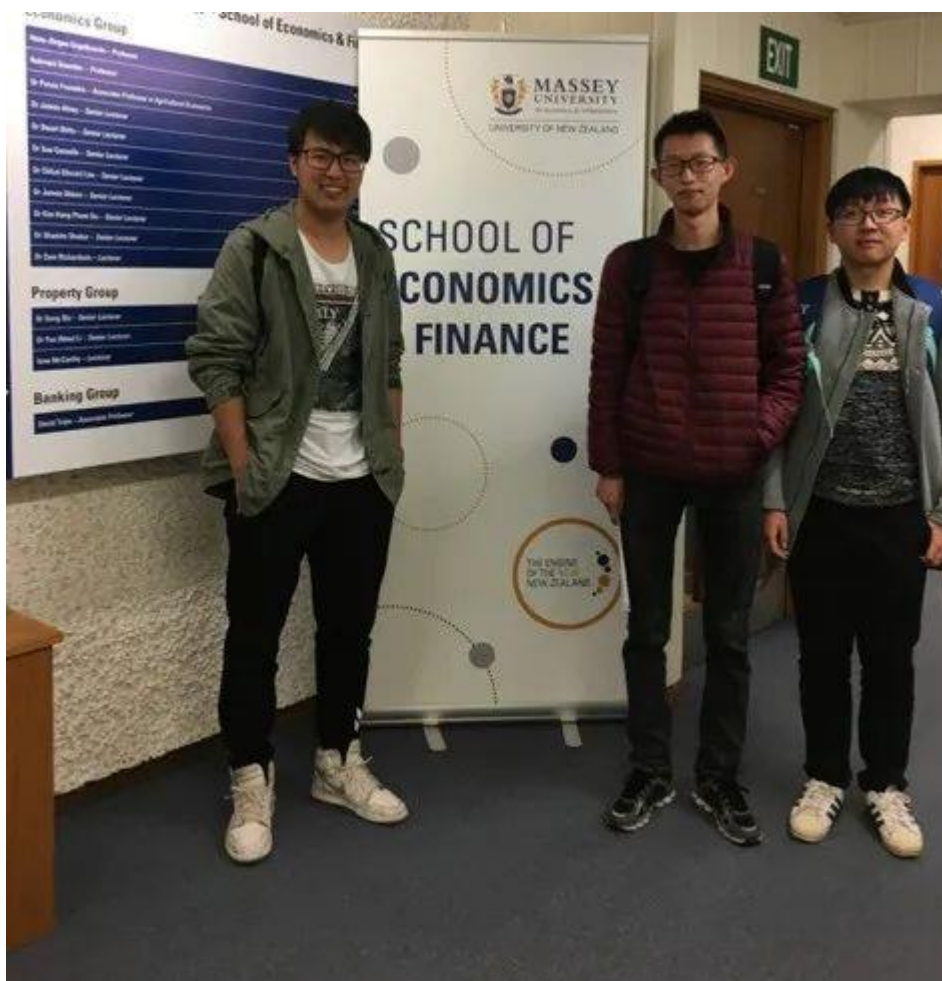
学生出国留学照片