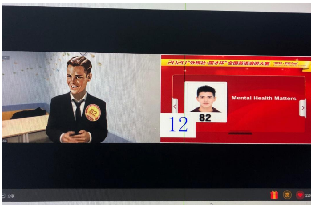
商务英语（跨国商务）方向学生获2020“外研社·国才杯”全国英语演讲大赛全国决赛二等奖